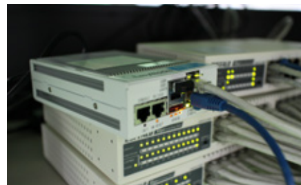
京丹後市内の学校で稼働中のEasyBlocks教育機関向けProxy AE

製品の選定が済み、まずは稼働テストを実施するための構築作業をするが、ここでも特に問題はなく、スムーズな構築が行えたという。“EasyBlocks教育機関向けProxy AE” はWebインターフェースからの初期設定のみで導入ができ、導入にかかる工数が非常に少ないのが特長のひとつだ。そして稼働テストでは大幅なインターネット通信環境の改善が認められ、本稼働環境への投入が決まった。本稼働が始まった直後、教職員からこれまでの不満が解消された旨の言葉が京丹後市教育委員会へ多く寄せられたという。