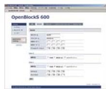
ネットワーク設定画面