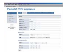
PacketiX VPN 環境設定画面