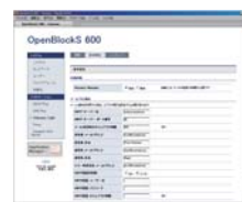
Hinemos® Light 環境設定画面